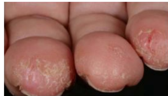
Allergi over for akrylat med eksem på fingerspidserne