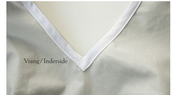
Vrang / Inderside