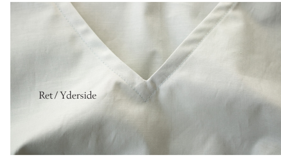
Ret / Yderside

Kan din symaskine ikke sy en stikning, der er pæn på begge sider, bør du få den tjekket hos en forhandler eller skifte den ud til en maskine, der syr lige pænt på over- og underside. Sømmene i denne vejledning er syet på en Brother Innovis 15.