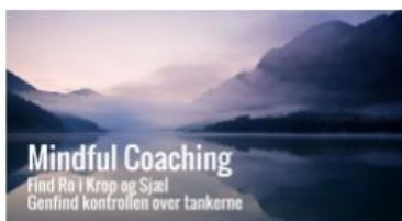
Mindful Coaching med CC