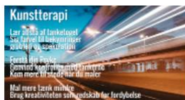
Kunstterapi - sådan står du af tanketoget