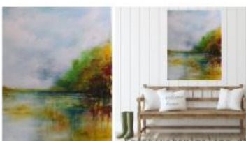
Mindful Maledage i Oktober