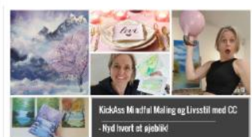
Kickass Mindful Maling og Livstil PROGRAM