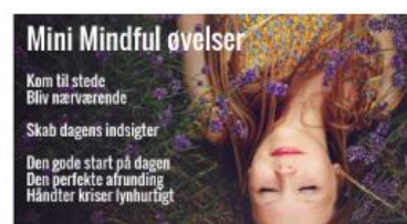
Mini mindful øvelser