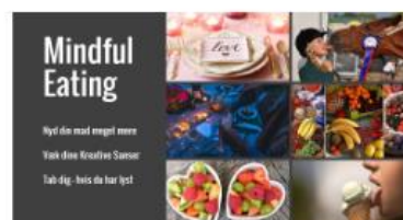
Mindful Eating - NYD din mad mere